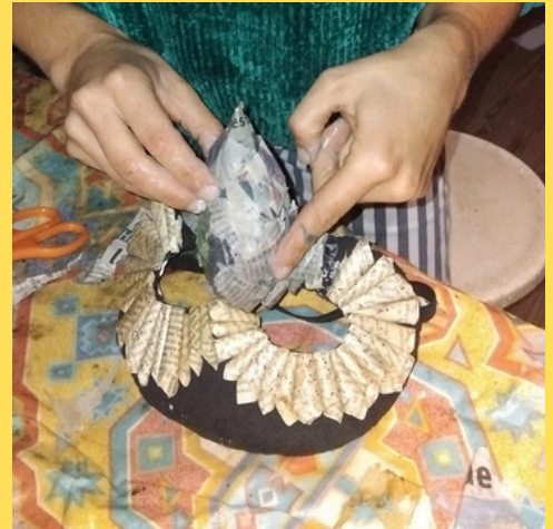
Personnaliser le masque