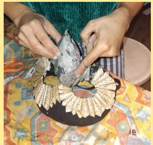
Personnaliser le masque