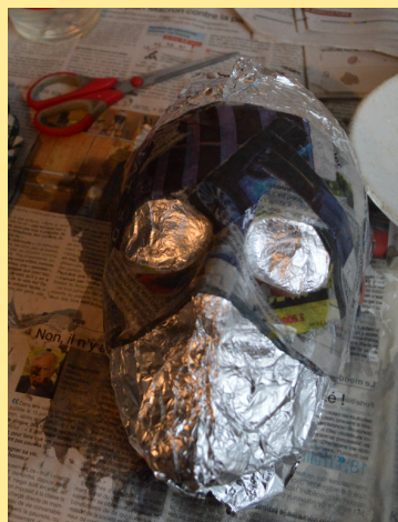
Créer le masque en papier mâché